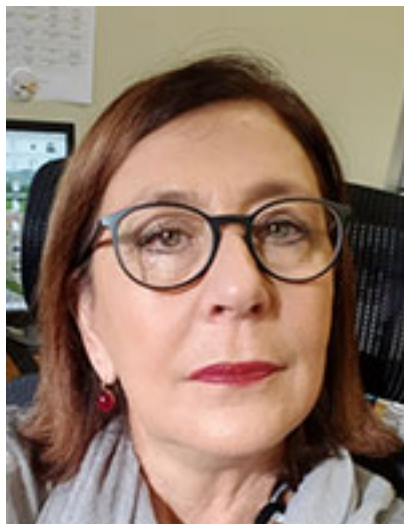
Prof. ssa Valeria Conte (Università di Roma Tor Vergata)

Per i suoi importanti contributi all'avanzamento degli studi di sistemi di ossi-funzionalizzazione di substrati organici in ambienti prevalentemente acquosi, che mimano i processi biologici puntando allo sviluppo di percorsi sintetici sostenibili.