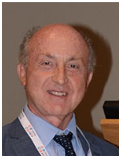
Prof. Marco D'Ischia (Università di Napoli)

Per l'originalità, l'ampiezza ed il valore delle sue ricerche sulla chimica ossidativa dei composti fenolici. Tali studi hanno spaziato, con rigore ed eleganza scientifica, dalla sintesi biomimetica, alla definizione dei meccanismi di reazione, fino alla caratterizzazione di polimeri melanici, consentendo una razionalizzazione delle relazioni struttura-proprietà di rilevante importanza per applicazioni biomediche e tecnologiche.