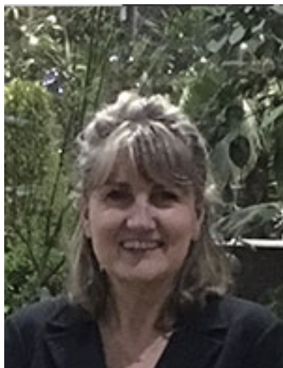
Prof. ssa Cristina Nativi (Università di Firenze)

Per avere saputo coniugare in modo originale ed innovativo la ricerca di nuovi percorsi sintetici efficienti e stereoselettivi di molecole di natura saccaridica con lo sviluppo di glicconiugati e mimetici in ambito bio-medico.