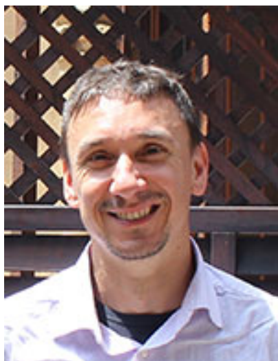
Prof. Andrea Basso (Università di Genova)

Per i suoi contributi rigorosi e creativi allo sviluppo di nuove metodologie fotochimiche e multicomponenti per la generazione di diversità chimica di rilevanza biologica Per l'alto interesse dei suoi studi sulla generazione indotta da luce di intermedi reattivi ed il loro utilizzo in processi sintetici eco-sostenibili.