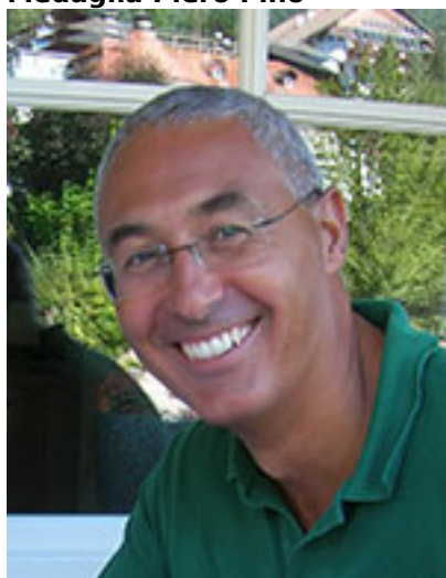
Prof. Maurizio Benaglia (Università di Milano)

Per aver contribuito con creatività e rigore metodologico allo sviluppo di nuovi sistemi organocatalitici, caratterizzati da elevata efficienza e basso impatto ambientale. I suoi studi hanno sviluppato protocolli di grande interesse in ambito industriale utilizzando reagenti supportati e riciclabili e progettando metodiche di sintesi basate su reazioni in flusso continuo. Le ricerche del Prof. Benaglia contribuiscono a colmare lo spazio concettuale e sperimentale tra le metodiche di laboratorio ed i processi di sintesi su larga scala