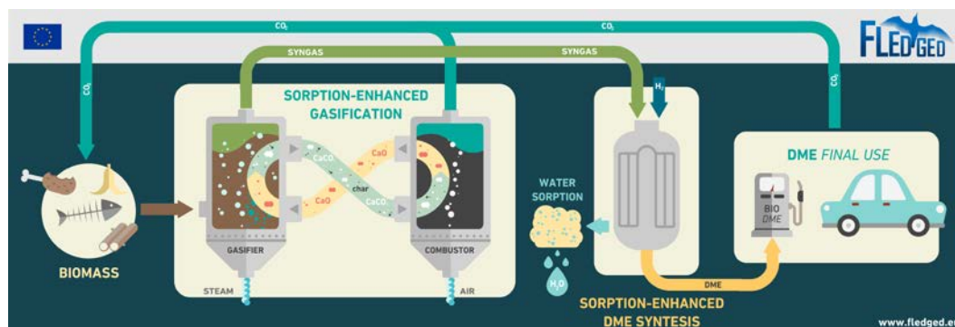
Il concept del progetto FLEDGED: dalla biomassa al biocombustibile tramite un processo reso più efficiente dall'uso di sorbenti

La riduzione delle emissioni di CO 2 dal settore dei trasporti è un obiettivo chiave delle politiche di sviluppo dell'Unione Europea. Una sempre maggiore diffusione di combustibili di origine biologica è una delle vie più promettenti per raggiungere questo obiettivo, soprattutto nel breve-medio termine grazie ad alcuni vantaggi rispetto a sistemi alternativi (quali ad esempio la mobilità elettrica o ad idrogeno). Infatti, l'utilizzo di biocombustibili consente di sfruttare l'infrastruttura esistente per il trasporto e lo stoccaggio del combustibile e non richiede modifiche, se non minime, alle autovetture già presenti sul mercato.