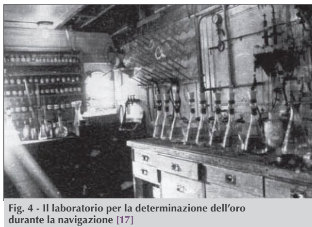
Fig. 4 - Il laboratorio per la determinazione dell'oro durante la navigazione [17]

La nave, utilizzata per il trasporto passeggeri sulla rotta Amburgo-New York, era stata modificata nei cantieri di Amburgo con l'allestimento del laboratorio per le analisi delle acque marine e i successivi trattamenti dei campioni che sarebbero stati raccolti nel corso del viaggio. Benché il gruppo cercasse di operare in modo discreto nell'immersione fuori bordo degli strumenti per il campionamento, le quattro brevi soste effettuate per tale scopo furono notate da alcuni passeggeri che credettero persino di aver visto la nave lasciar dietro di sé una scia blu cangiante, non appena ripresa la navigazione. La stampa statunitense dette grande risalto alle ricerche dello scienziato tedesco, con articoli che si lanciarono in ipotesi più o meno fantasiose sugli scopi degli esperimenti che si compivano a bordo della nave, legati al problema della corrosione dei metalli o