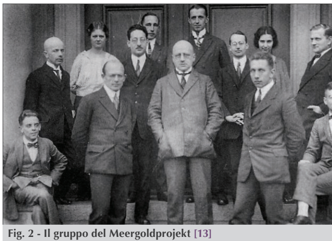
Fig. 2 - Il gruppo del Meergoldprojekt [13]

trando quantità di oro coerenti con i valori medi trovati in precedenza. In particolare, Haber riteneva significativo il fatto che nel Mare del Nord la concentrazione del metallo aumentasse man mano che i campioni venivano prelevati lontano dalla foce dei fiumi e tendesse proporzionalmente alla concentrazione salina dell'acqua di mare. Era perciò ragionevole che anche in alto mare l'oro fosse presente con una distribuzione omogenea ed in quantità sufficiente [15]. Le analisi dell'acqua del Reno (1925) indicavano la via della ricerca "verso il mare". Haber scrisse: « Il Reno è un fiume d'oro e, del resto, lo stato del Baden un secolo fa ve ne aveva ricavato l'oro per le sue monete... Con un semplice calcolo si poteva prevedere che nel corso di un anno la quantità di oro trasportata dal fiume fosse circa 200 kg » [16].