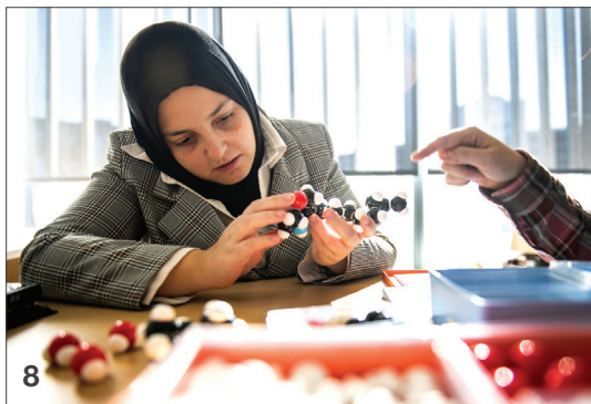
Immagine di copertina per gentile concessione di Sherwin-Williams, Bologna