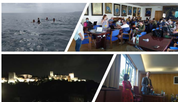
Fig. 3 - Un riassunto visivo del programma scientifico/culturale di full-immersion del To.Sc.Al'And di Granada